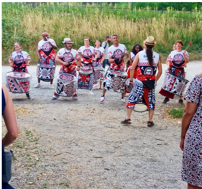
21 mai : première de Gare à Zik