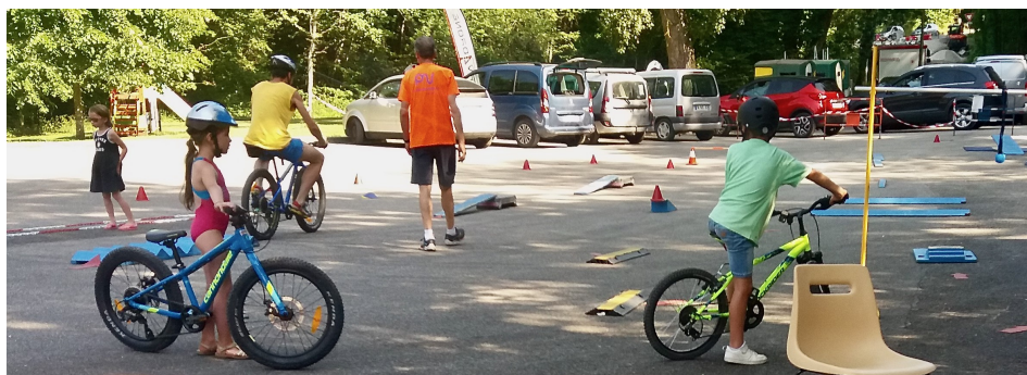
18 juin : deuxième édition des ateliers découverte

Instructif et convivial, comme d'habitude... Dommage, peu de monde, le temps caniculaire vous a sans doute fait préférer rester au frais.