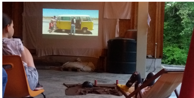
27 mai : Un franc succès pour cette belle et conviviale soirée cinéma à la Fruitière