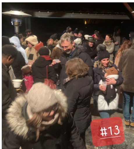
L'école et le périscolaire. Récréatif... les enfants ont bien travaillé !