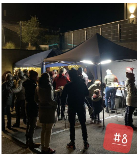
Familles Fantastico et Benbkhat, au Prunier. Chapeau le cuistot !