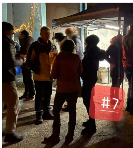
Famille Noël et les voisins de Crêt. Ça, c'est Crêt !