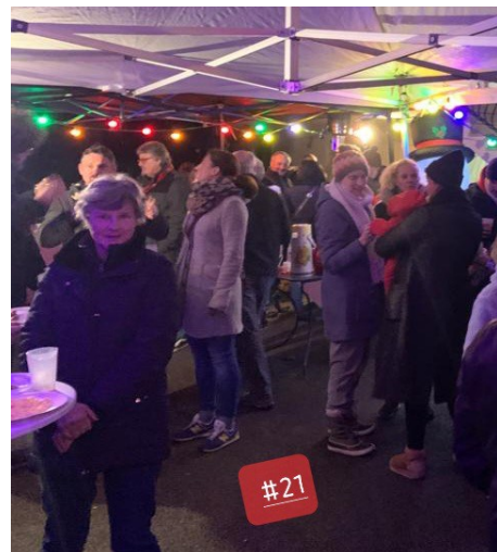
Voisins de Pré-Favière. «Raves party»