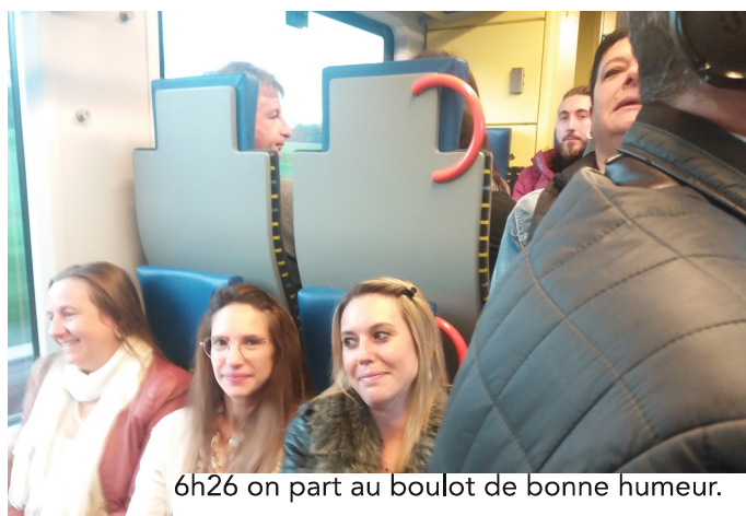
6h26 on part au boulot de bonne humeur.