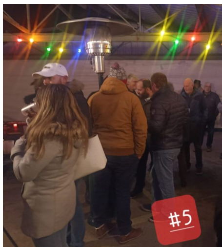
Festi'Pouigny, au stade. La gueule de bois...