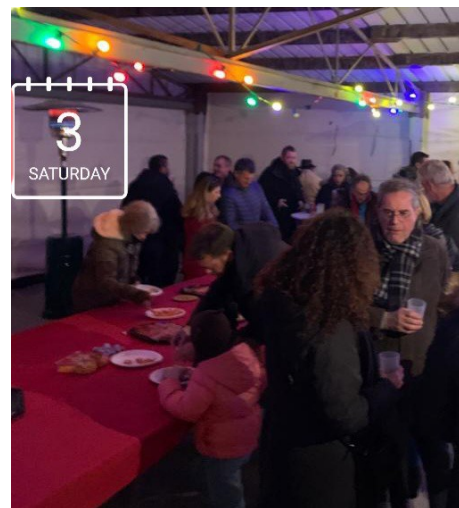
Comité des fêtes, au stade. L'orgie...