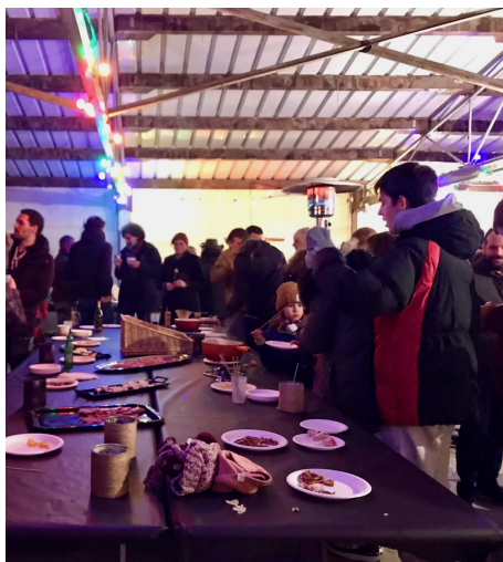
Rugby Club du Canton de Collonges, au stade. Un bel aménagement, beaucoup d'enfants, cosy....