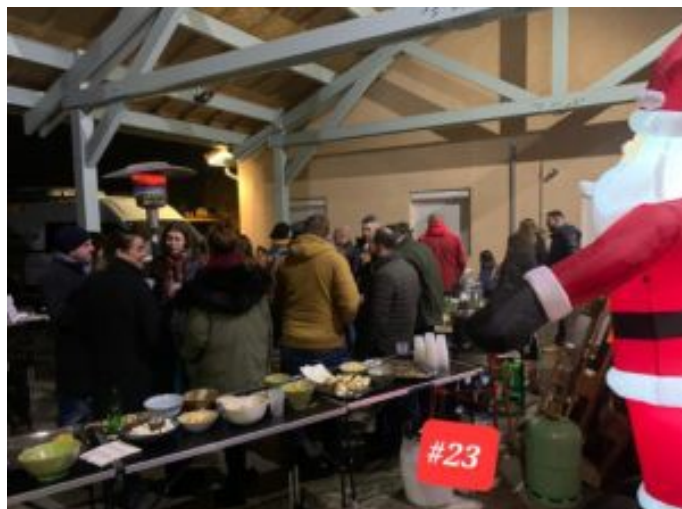
CCAS. La finale sous la pluie