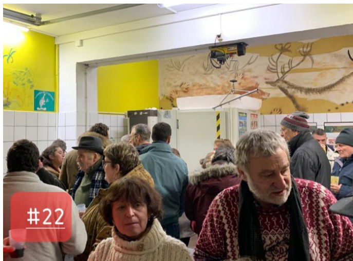
Société de chasse. Un menu chasseur