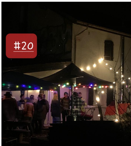
Famille Scholl. Cuisine du monde au "bout du monde" de Pouigny