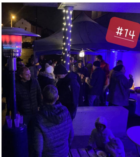
Pousse ta culture, au Château Vert. C'est un bon début.