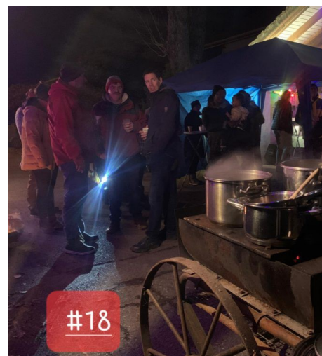
Pierrot et l'allée du Château. Guinguette au bord du bassin...