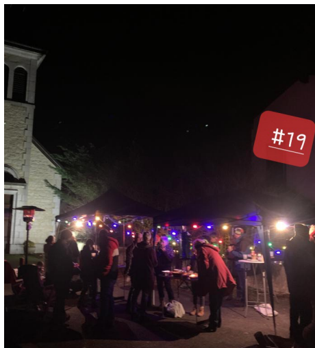
Parvis de l'église - Cathy Macia. Un avant-goût de la Fête des voisins