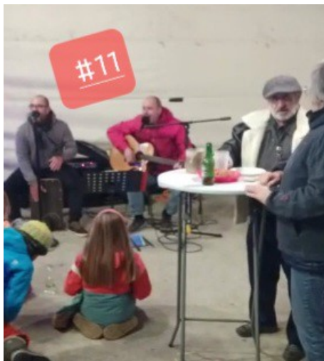
Festi'live, au stade. Et en avant la musique!