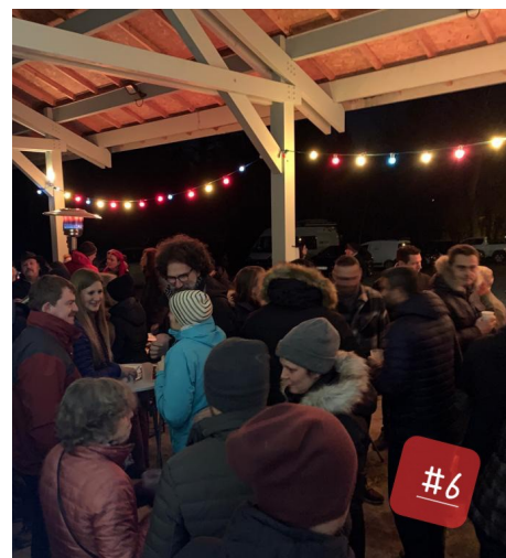
Sou des écoles, à la Fruitière. La belle équipe, comme d'hab !