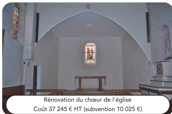
Rénovation du chœur de l'église Coût 37 245 € HT (subvention 10 025 €)