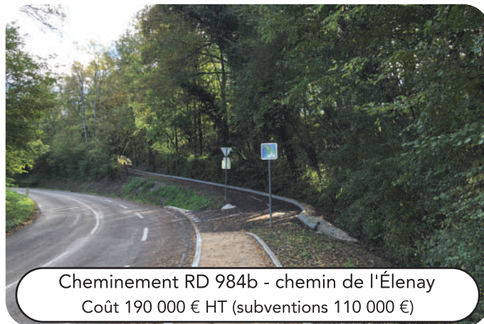
Cheminement RD 984b - chemin de l'Élenay Coût 190 000 € HT (subventions 110 000 €)