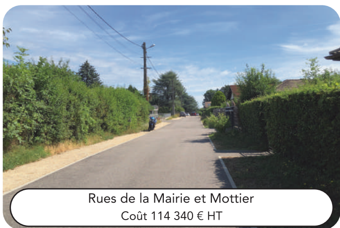
Rues de la Mairie et Mottier Coût 114 340 € HT