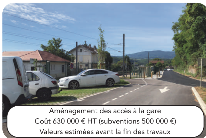
Aménagement des accès à la gare Coût 630 000 € HT (subventions 500 000 €) Valeurs estimées avant la fin des travaux