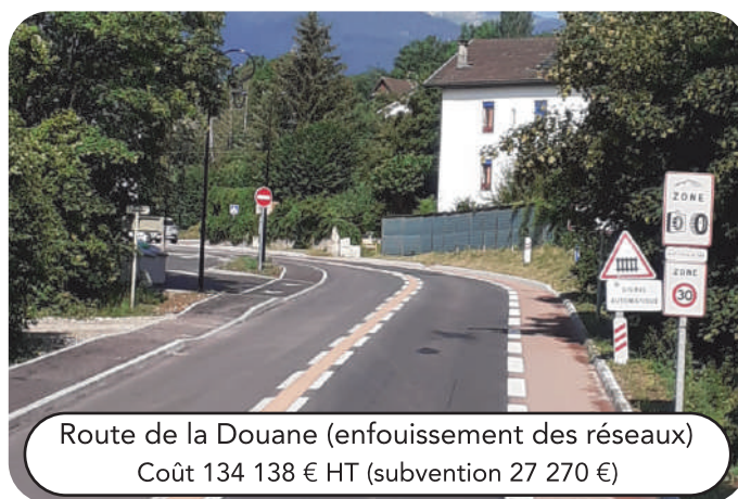
Route de la Douane (enfouissement des réseaux) Coût 134 138 € HT (subvention 27 270 €)