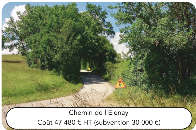
Chemin de l'Élenay Coût 47 480 € HT (subvention 30 000 €)