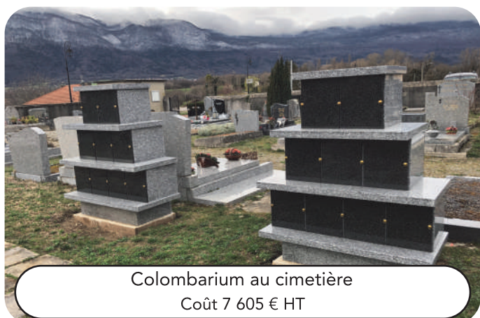
Colombarium au cimetière Coût 7 605 € HT

L'école est passée de 66 élèves à la rentrée 2019 à 86 en 2020 pour arriver à près de 130 à la rentrée 2025. Classes modulaires, coût 421 902 € HT (subventions 181 249 €) - agrandissement, coût 1 391 651 € HT (subventions 450 000 €)